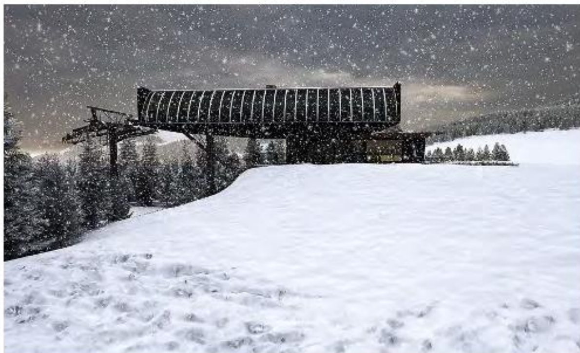
Rendering del progetto, corpo a monte

Le novità nell'offerta di Funivie di Campiglio