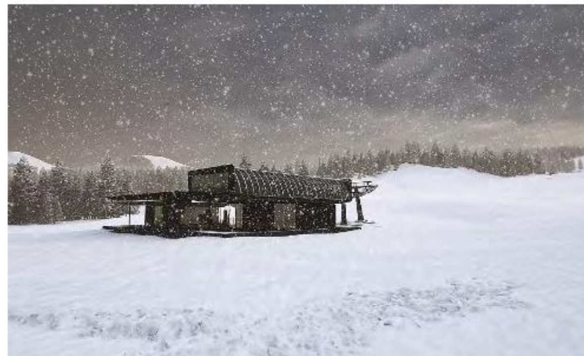
Rendering del progetto, corpo a valle

La storica seggiovia 2 posti "Nube d'Argento" cede il passo moderna cabinovia a 10 posti , progettata per offrire un comfort e una sicurezza senza precedenti. Dotato di un sistema di controllo automatico, il nuovo impianto è pensato per accogliere ogni tipo di utente: famiglie con bambini, persone con disabilità e anche gli amici a quattro zampe. L'intervento si inserisce in un progetto di più ampio respiro che prevede la realizzazione entro un paio d'anni di una nuova Family Land con la creazione di servizi di alto livello dedicati alla famiglia. Il progetto Family Land sarà realizzato nei pressi del campo da golf di Passo Campo Carlo Magno, dove una vecchia malga diventerà il centro nevralgico del nuovo parco.